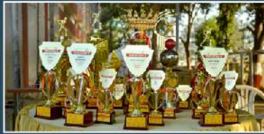
Trophies of Khelotsav-5