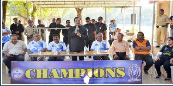
Chief Guest - Padmashri. Adv. Shri. Ujjwal Nikam